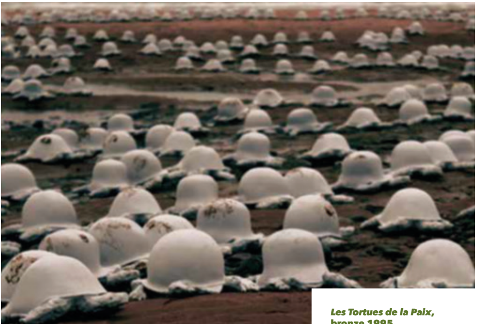
Les Tortues de la Paix, bronze 1995,

L'une de ses œuvres les plus connues. Rachid Khimoune a grandi avec des tortues. Cet animal, symbole de sagesse, porte le monde en Asie, dans les maisons berbères, la tortue chasse les mauvais esprits et la protège des mauvais sorts. Dans les années 1990, l'artiste commence à