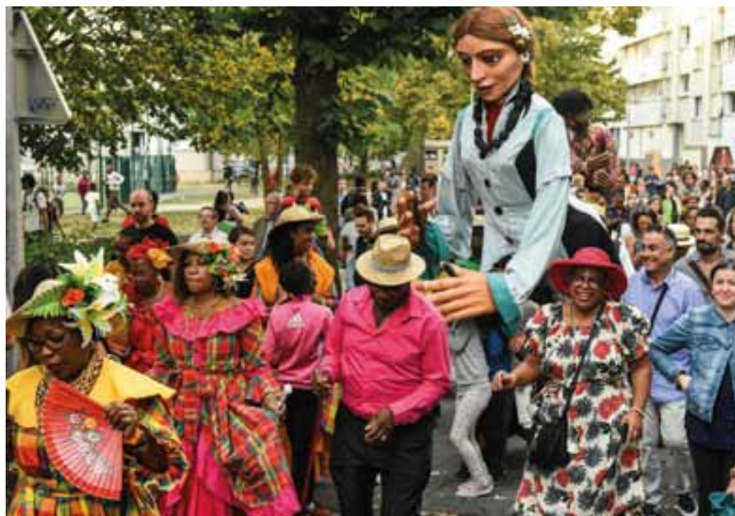
Une Parade tropicale a été organisée à l'occasion de l'ouverture du festival.

» Jusqu'au 11 novembre. Le 8 novembre à 19h, concert de La Cité des marmots (400 écoliers de la Seine-Saint-Denis) et du chanteur réunionnais René Lacaille à l'Embarcadere.